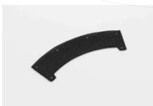
Banda de sudor estándar HYG3