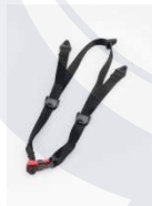
Barboquejo de 3 puntas GH4