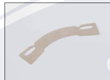
Banda de sudor de cuero HYG4