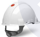
Casco G3001 color blanco (sin ventilación) SN: XH-0016-7523-6