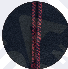
Detalle costuras de la manta

En caso de haber utilizado una manta anteriormente, esta referencia está pensada para reemplazarla sin necesidad de comprar el packaging. Incluye instrucciones de uso, mantenimiento y plegado.